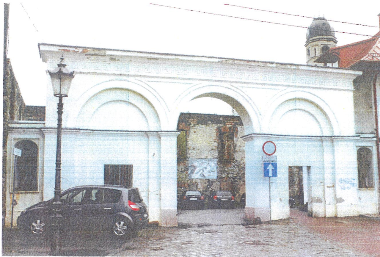
Fot. 1: Brama Zamkowa w Strzelcach Opolskich.