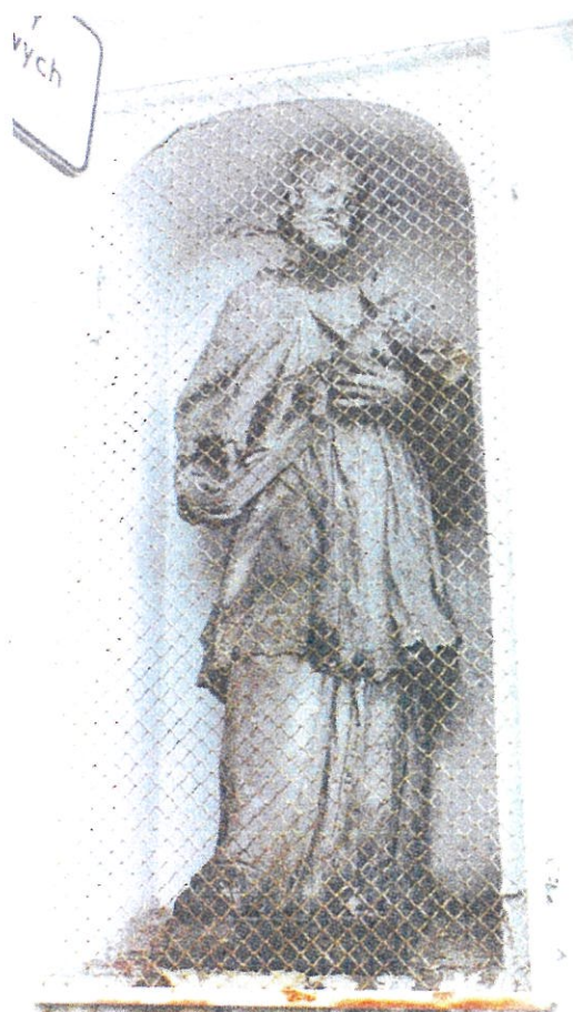
Fot. 2: Św. Nepomucen.