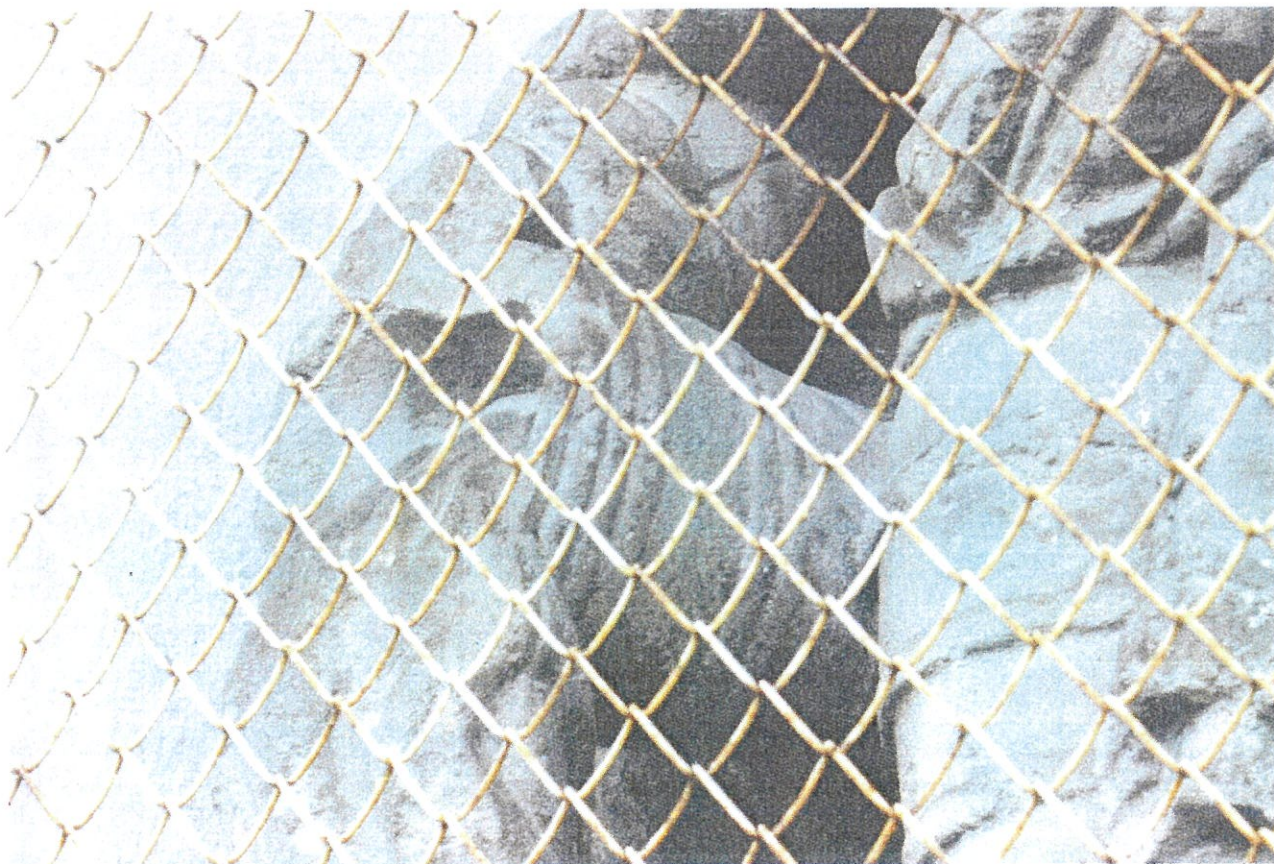
Fot. 6: Największy ubytek – brak ręki św. Floriana.