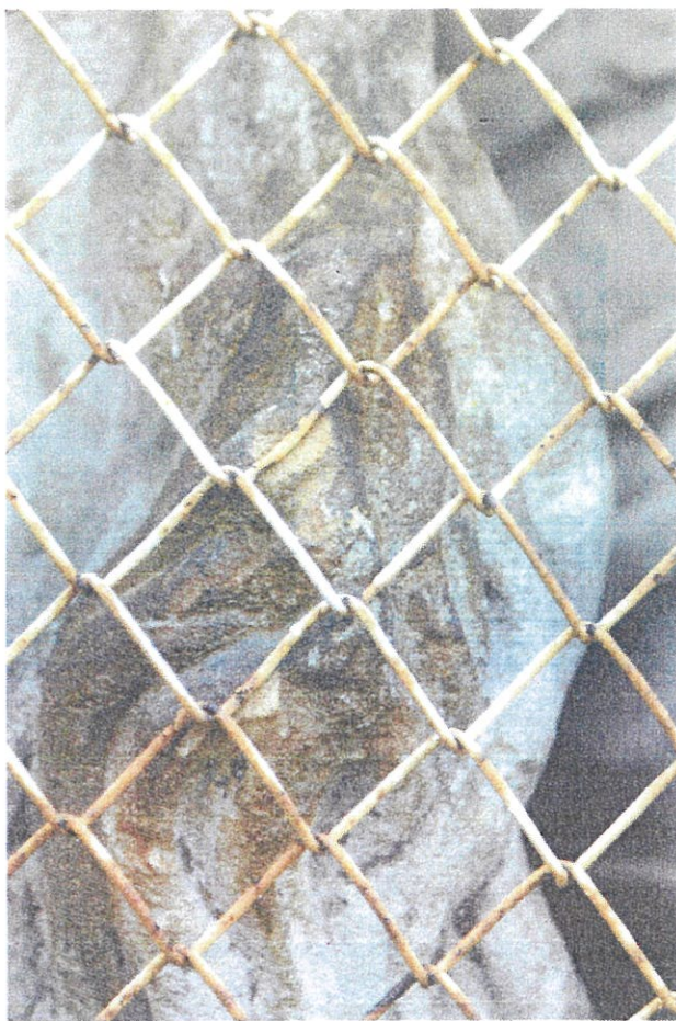
Fot. 5: Silnie przebarwiona powierzchnia.