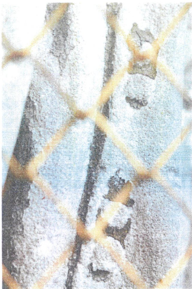
Fot. 4: Resztki starej farby.